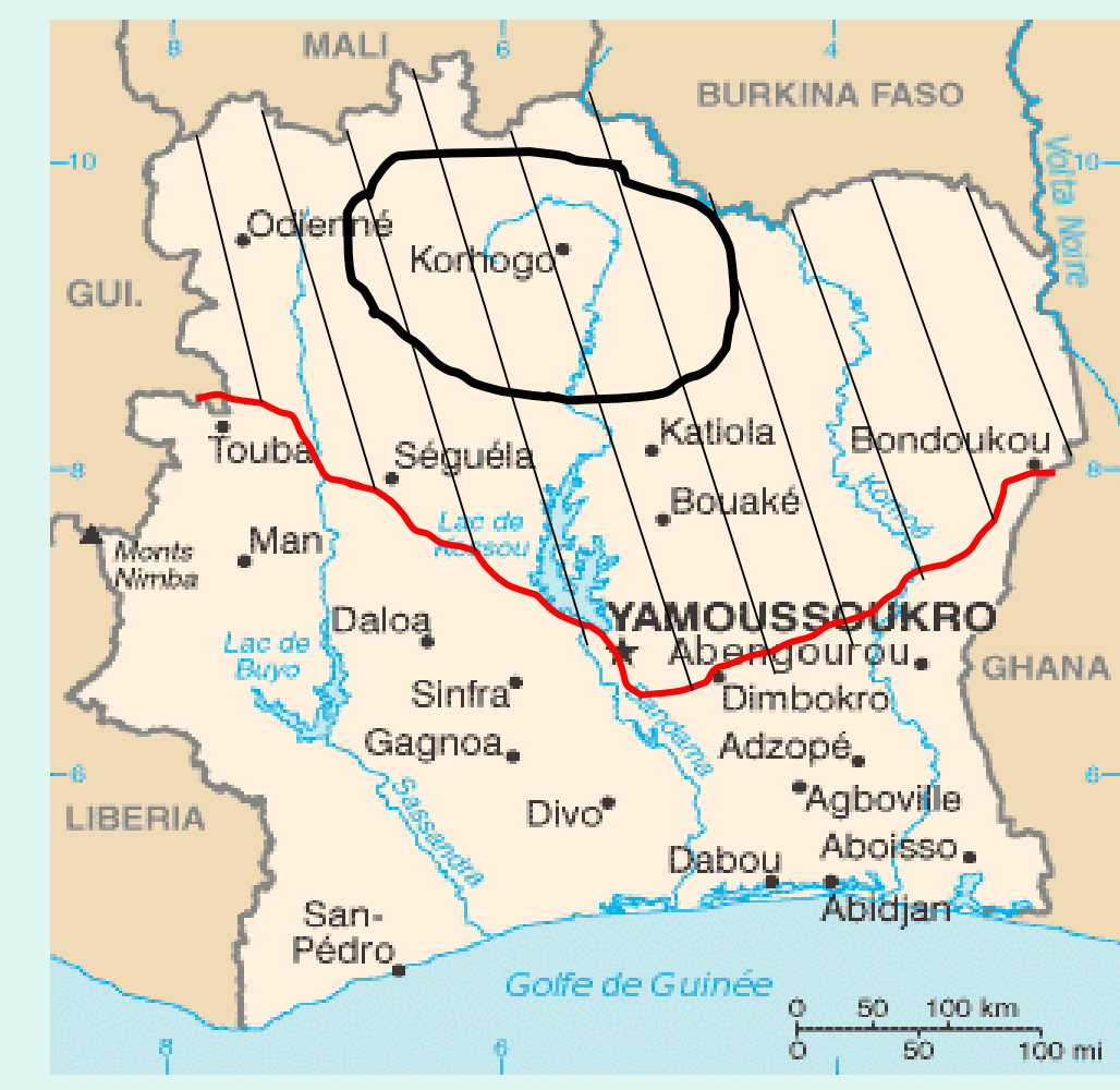
/// : Principales régions d'élevage bovin laitier, ○ : zone de l'étude